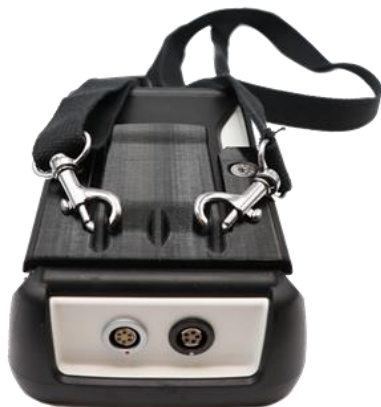
Radcount-3 s popruhem přes rameno