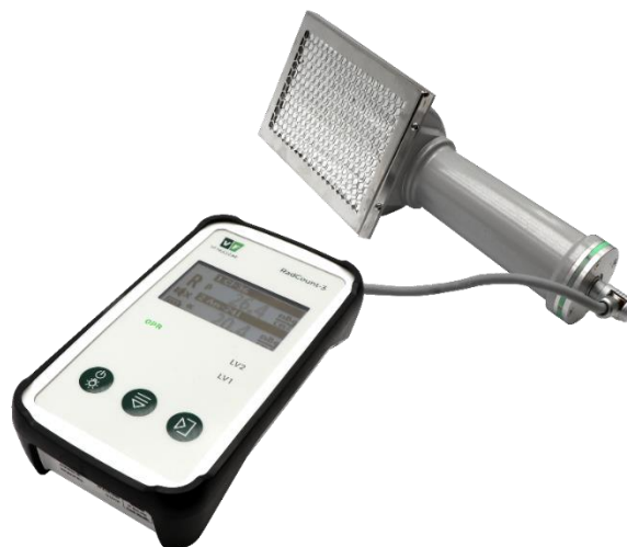
Radcount-3 s připojenou sondou SFP-100