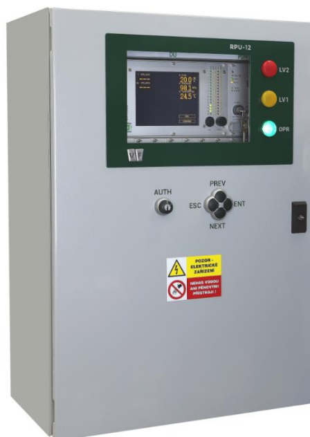
Jednotka sběru a zpracování dat RPU-12