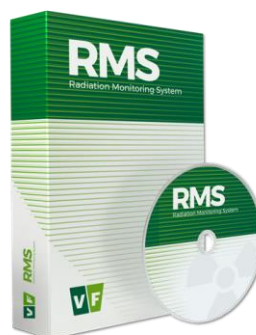
Radiační monitorovací systém RMS