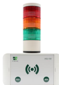
Signalizační jednotka ASU-50