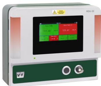
Zobrazovací jednotka RDU-22