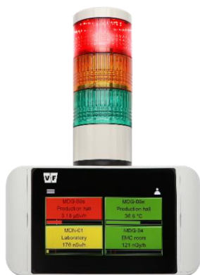
RDU-02 se signální věží