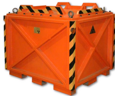
Obalový soubor PO-02