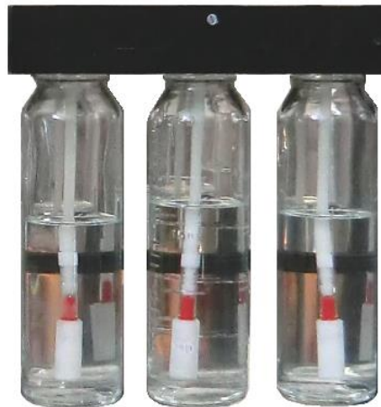
Kazeta s nádobami s roztokem NaOH