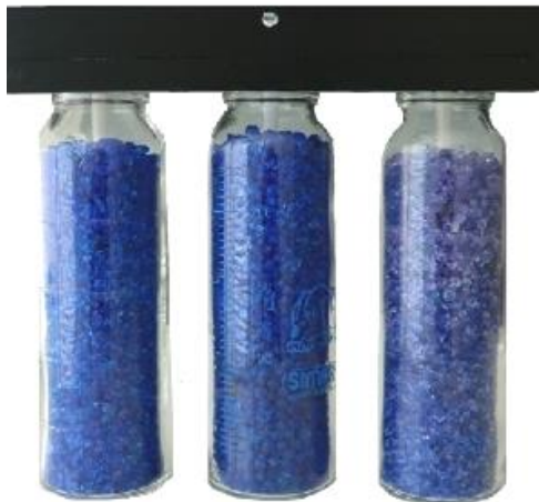
Kazeta s nádobami se silikagelem