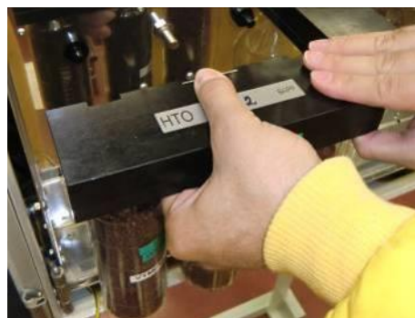
Vložení kazety s odběrovými nádobami se silikagelem