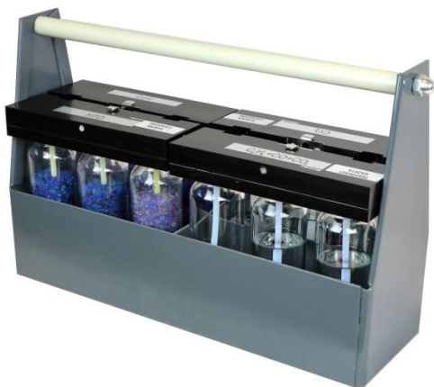
Převravnka na kazety