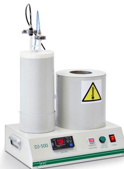
Desorpční jednotka DJ-500