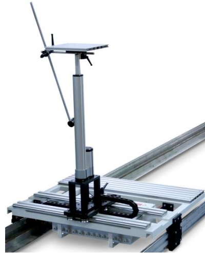
Kalibrační lavice CB-50