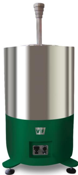
Panoramatický ozařovač PGI-01