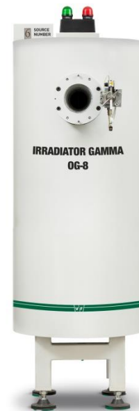
Gama ozařovač OG-8